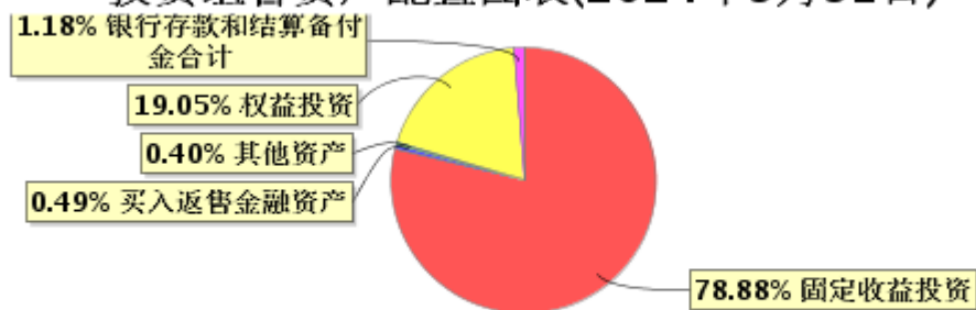
投资组合资产配置图表(2024年3月31日)

● 固定收益投资 ● 买入返售金融资产 ● 其他资产 ● 权益投资 ● 银行存款和结算备付金合计