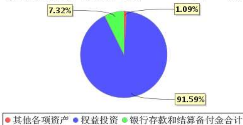
投资组合资产配置图表(2021年9月30日)