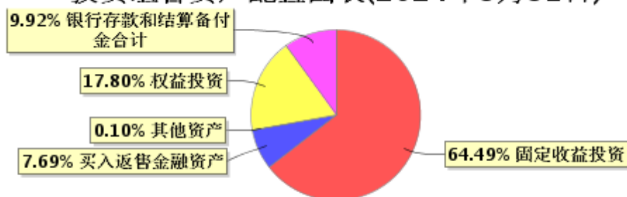
投资组合资产配置图表(2024年3月31日)

● 固定收益投资 ● 买入返售金融资产 ● 其他资产 ● 权益投资 ● 银行存款和结算备付金合计