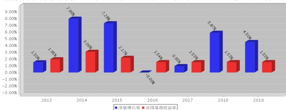
建信安心回报定期开放债券C基金每年净值增长率与同期业绩比较基准收益率的对比图(2019年12月31日)